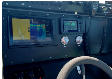
Modernos equipamentos de navegação Modern equipments of navigation