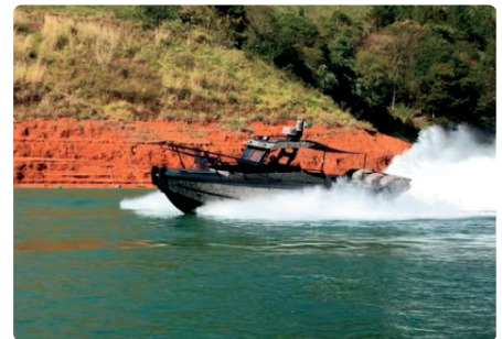
Alta Manobrabilidade High Maneuverability